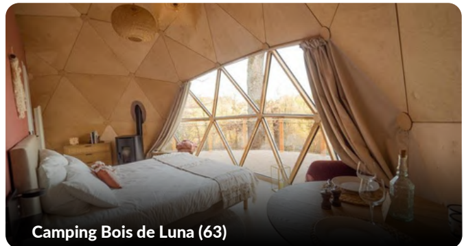
Camping Bois de Luna (63)